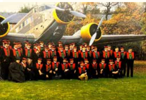
1983 führte der Ausflug die Schenner Musikanten mit dem Flugzeug nach Schleswig-Holstein, wo sie ein Konzert in Kiel spielten.

bestand das Repertoire vor allem aus traditioneller Blasmusik, die zu kirchlichen Anlässen und Dorffesten erklang. Über die Jahrzehnte hinweg entwickelte sich die Kapelle stetig weiter: Die musikalische Bandbreite wuchs, neue Instrumente kamen hinzu, und das Ensemble wurde zu einem festen Bestandteil des kulturellen Lebens im Dorf. Besonders prägend waren die Nachkriegsjahre, als die Musik zu einem Symbol für Hoffnung und Zusammenhalt wurde. Heute beeindruckt die Musikkapelle Schenna mit ihrem 60 Frau und Mann starken Klangkörper.